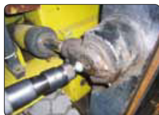
Nr. 290 220 Code: OE29000029