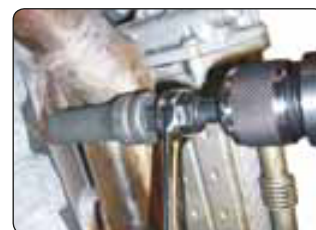
Nr. 290 241 Code: OE39000039