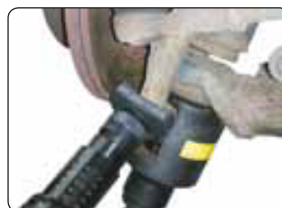
Nr. 290 230 Code: OE46000046