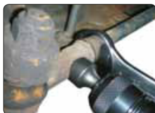
Nr. 290 210 Code: OE29000029